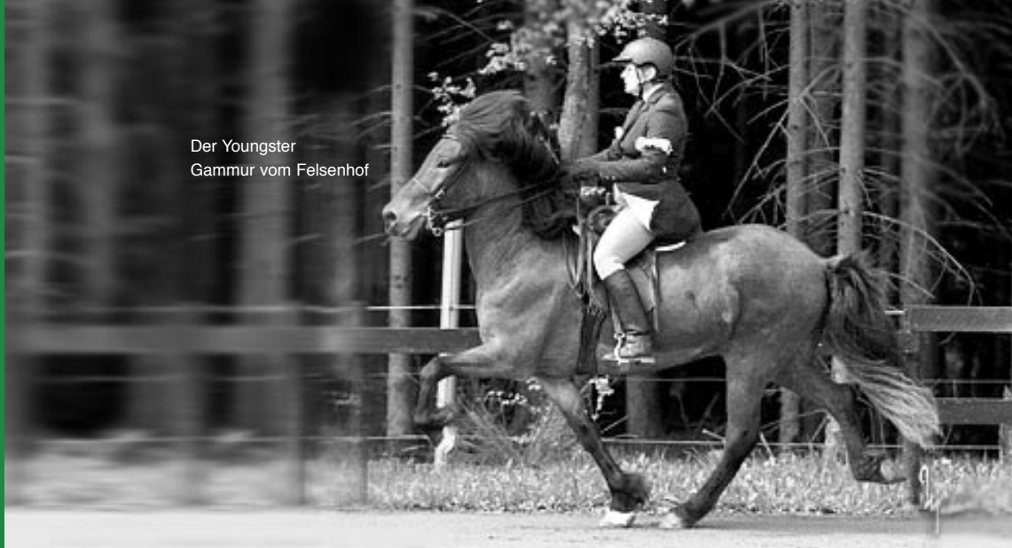
Der Youngster Gammur vom Felsenhof